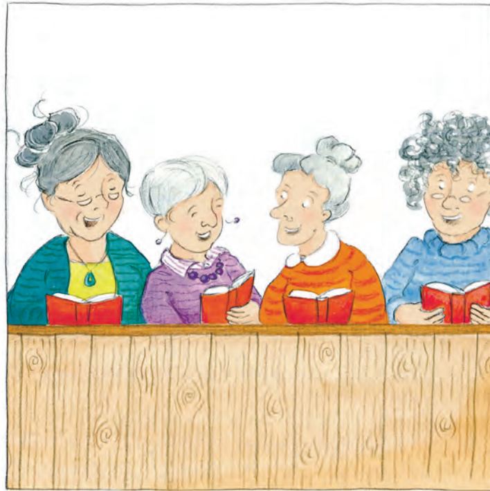
Illustratie: Hester Nijhoff

Meteen al in het eerste lied doemen ze op. 'Er is kracht, kracht, wonderbare kracht in het dierbaar bloed van het Lam...' Wie zingt dat nog? Zouden jongeren dat niet erg bloederig vinden? Maar het evangelie klinkt in een notendop, zoals ook de tantetjes het vol overtuiging uitdroegen. In eenvoudige woorden schetst dominee M. vervolgens hoe geniepig en listig de satan te werk gaat, hoe hij Jezus wilde verleiden