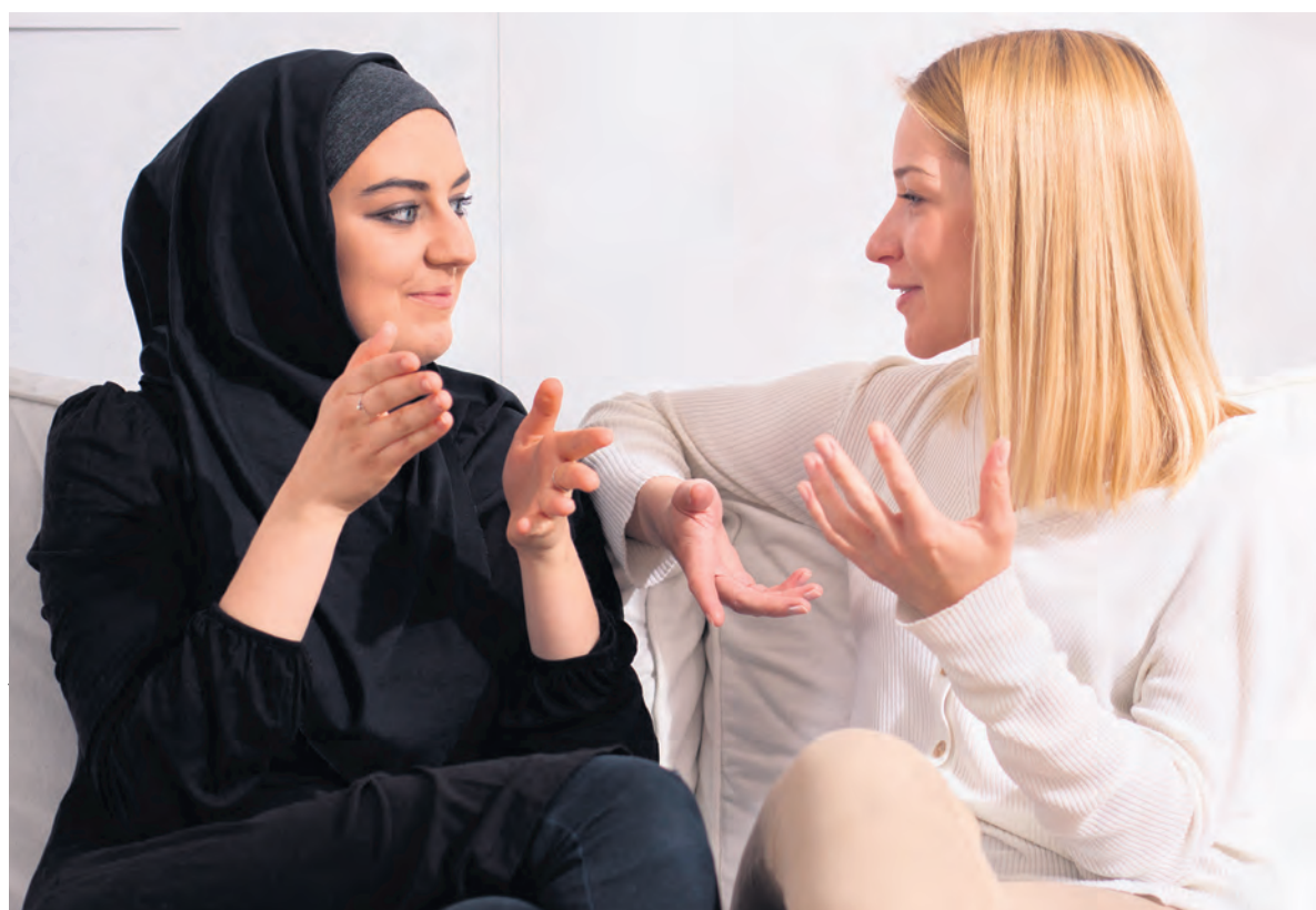
Het gesprek wordt pas echt interessant als je verschillende gezichtspunten met elkaar kunt delen.

Hartelijke groeten en een goede en gezegende week toegewenst.