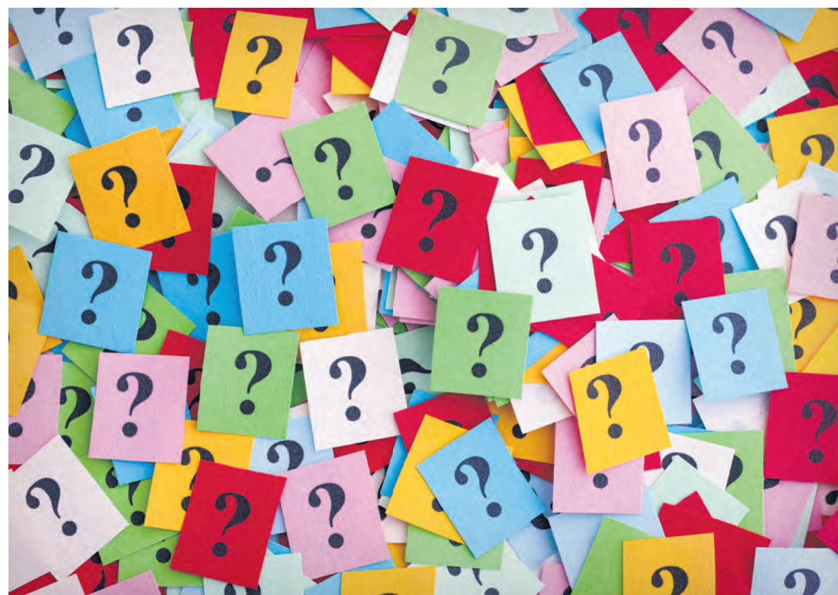
Laten we weer leren vragen te stellen en te ontdekken

Woensdag 13 februari, 19.30 uur, Coevorden, De Hoeksteen, Rabenhauptstr. 1 info: Ds. en mevr. Oldenhuis: 0524-511511