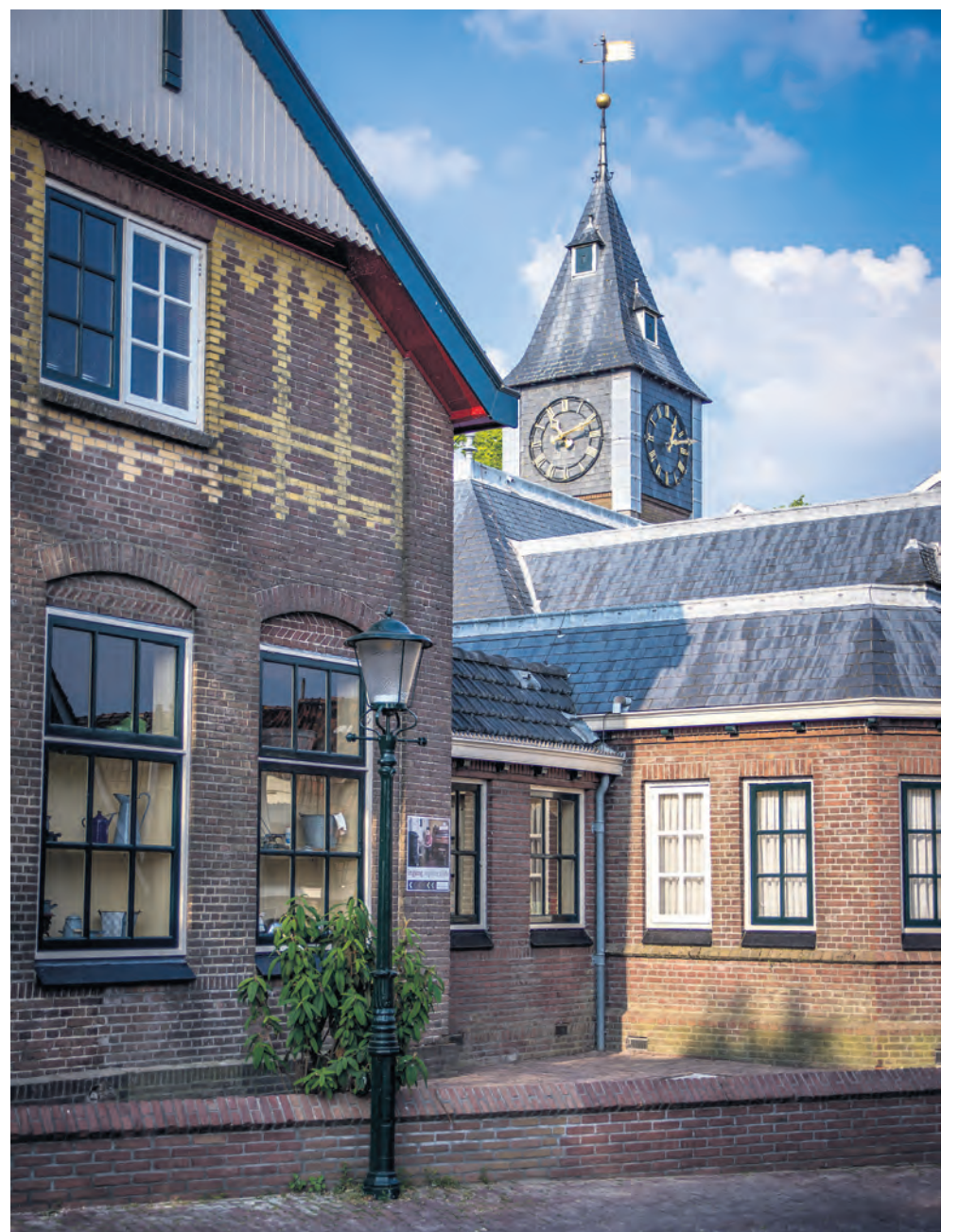
De dorpskerkenbeweging stelt de vraag hoe kerken bijdragen aan de leefbaarheid van het platteland. Op de foto: Kerk op Urk, Flevoland