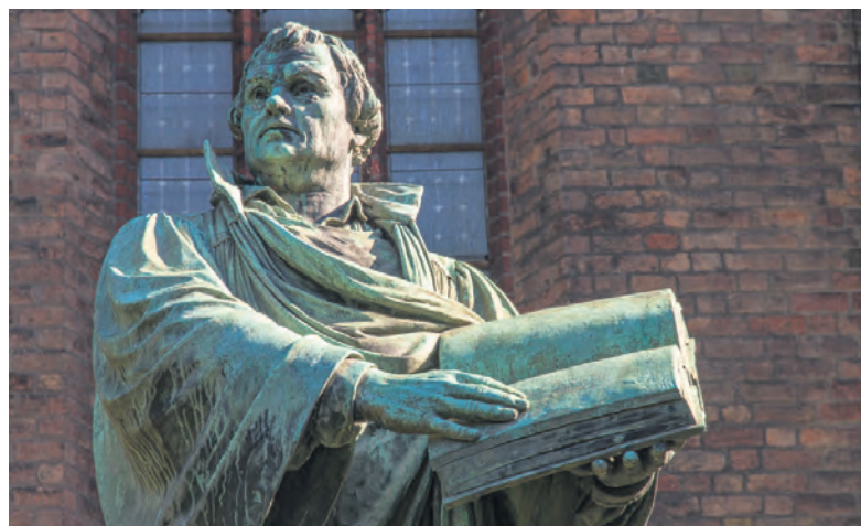
Reformator Maarten Luther in het centrum van Berlijn. In 2017 vierde Nederland 500 jaar Reformatie.

Optreden tegen sociaal en economisch onrecht, tegen kerkelijk misbruik en tegen bijgeloof, dat zijn kenmerken van het leven van Huldrych Zwingli (1484-1531), de reformator van Zwitserland. Maar ook een gezonde relatie tussen kerk en staat, aandacht voor spiritualiteit, en voor de schoonheid van de natuur, horen bij de thema's van deze reformator en van zijn collega's in Basel en Bern. Thema's overigens die ook van invloed waren op de Nederlanden. De Zwitserse Reformatie viert in 2019 haar 500-jarig jubileum en de thema's die daar in de zestiende eeuw speelden zijn vandaag zeer actueel, en dat wereldwijd. Het Coram Deo Program organiseert van 20 tot 24 mei in samenwerking met DrieTour een reis naar de prachtige steden, kloosters en kerken waar Zwingli en de zijnen gewerkt hebben. Niet alleen om die plaatsen te bekijken maar ook om van de waarden die destijds (her)ontdekt werden te leren en die toe te passen. In deze reis komen vooral de waarden verantwoordelijkheid en gerechtigheid aan de orde.