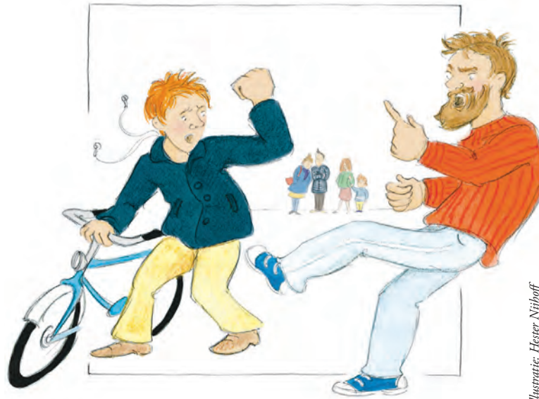
Illustratie: Heester Nijhoff

Als de volwassenen niet aardig zijn, waarom zouden de kinderen het dan wel zijn? Goeie vraag. Maar Jezus onze Leermeester heeft een afdoende remedie tegen zulk vloeken en tieren. Eentje die veel verder gaat dan aardig zijn voor elkaar: "Zegen elkaar, spreek goede woorden..." En dat mag best in stilte.