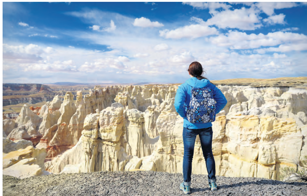
De verhalen van de mannen en vrouwen die jarenlang geworsteld hebben met hun homoseksuele gevoelens en zich door meerdere kerken afgewezen voelden, zijn legio.

HET LIJKT ALSOF ER MAAR ÉÉN MANIER IS OM DE BIJBEL TE LEZEN EN DAT ELKE ANDERE MANIER PER DEFINITIE NIET GOED IS.