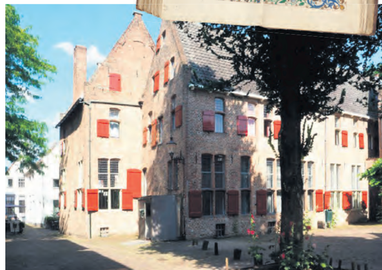
Het Buiskens klooster te Deventer