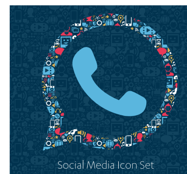
Social Media Icon Set