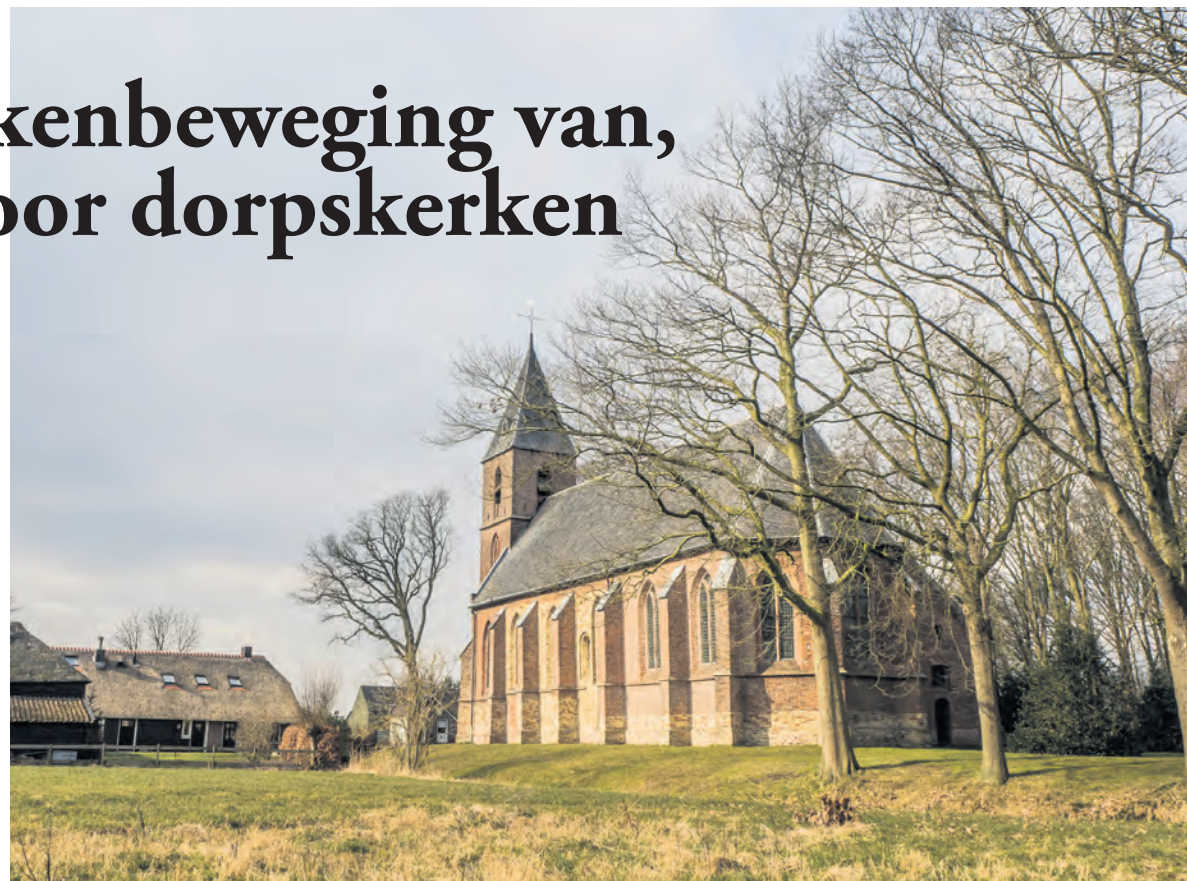
De Hervormde Gemeente in Ruinerwold (Drenthe) kerkt in de gotische Bartholomeuskerk, gebouwd rond 1500.

Veel dorpskerkgemeenschappen zijn klein maar vitaal en maken deel uit van de dorpscultuur. Er zijn echter ook dorpskerken die de deuren moeten sluiten. Wat zijn dan de mogelijkheden om als geloofsgemeenschap zichtbaar aanwezig te blijven in het dorp? Hoe kan de dorpskerk lokaal van