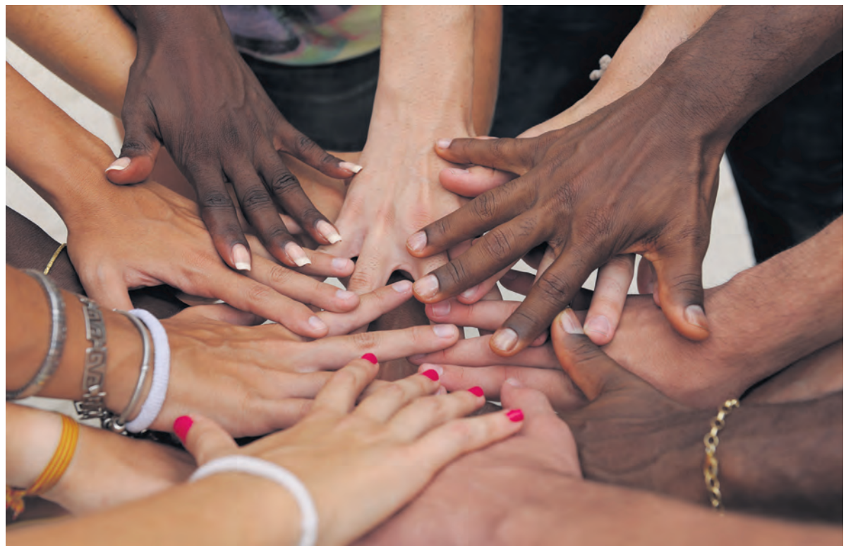
Er is wel eens berekend hoeveel de kerken met hun talloze vrijwilligers de samenleving besparen. Dat zou weleens we in de miljoenen, zoal niet miljarden kunnen lopen.

Tot slot: mijn woordenboek geeft (zelfs als eerste) nog een heel andere betekenis van 'leeglopen': 'het in werking zijn van een machine zonder dat er wordt geproduceerd'. Nu, daar lijkt de kerkelijke praktijk al helemaal niet op. Kerken produceren juist heel veel, niet alleen voor de eigen leden maar ook in de samenleving als geheel. Er is wel eens berekend hoeveel de kerken met hun talloze vrijwilligers de samenleving besparen. Zou al dat werk door professionals gedaan moeten worden, dan komen we in de miljoenen, zoal niet miljarden terecht. Ik ben niet zo'n fan van zulke rekensommetjes, maar toch: hoezo 'leeglopen'?