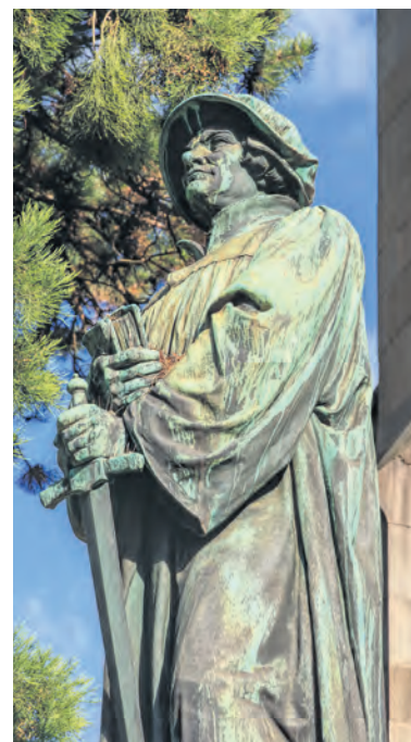
Reformator Huldrych Zwingli bij de Wasserkirche in Zürich. In 2019 viert Zwitserland 500 jaar Reformatie.