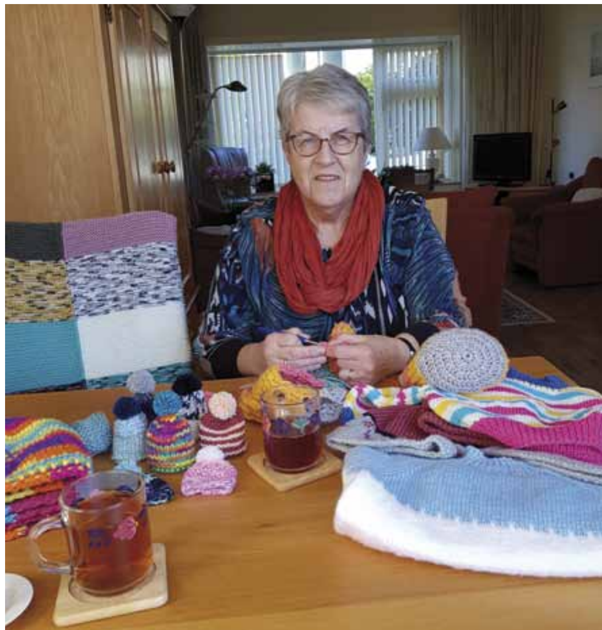
Diet Bril: We breien dekens, sjaals, mutsen en nog veel meer. Kleine Kracht brengt het zelf naar Roemenië, waar de spullen verdeeld worden onder verschillende families

Informatie voor de (muziek)agenda kunt u mailen naar: nieuws@gezamenlijkzondagsblad.nl