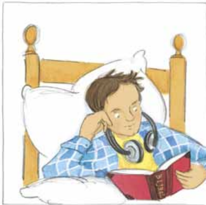
Illustratie: Hester Nijhoff

Gelukkig is er die ene onveranderlijke zekerheid, old school bij uitstek. Hij, de Eeuwige, die alle onzekerheid verre te boven gaat. Onze Vader. Altijd Dezelfde. In Hem geen zweem van ommekeer.