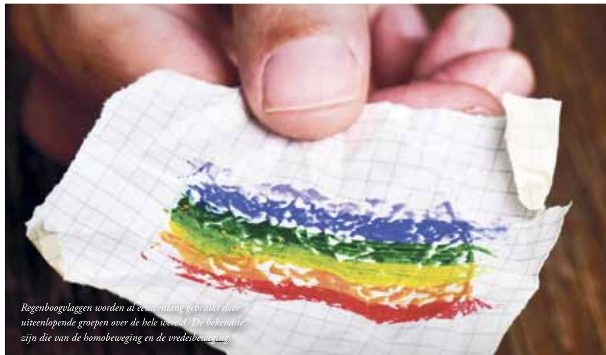
Regenboogvlaggen worden al eeuwenlang gebruikt door uiteenlopende groepen over de hele wereld. De bekendste zijn die van de homobeweging en de vredesbeweging.

Burgerlijke en politieke vrijheidsrechten zijn: recht op gelijke behandeling zonder onderscheid van welke aard ook; recht op leven, vrijheid en onschendbaarheid; geen slavernij; geen foltering of andere onmenselijke behandeling; erkenning voor de wet als persoon; recht op gelijke rechtsbescherming; recht op rechtshulp; geen arrestatie, gevangenschap of verbanning naar willekeur; recht op onafhankelijke rechtspraak; recht op veronderstelde onschuld, tenzij strafbare schuld bewezen wordt; recht op privacy zonder willekeurige inmenging; vrijheid van beweging binnen en buiten alle grenzen; recht op bescherming tegen vervolging vanwege politieke overtuiging; recht op nationaliteit; recht om in vrijheid te trouwen en een gezin te stichten; recht op