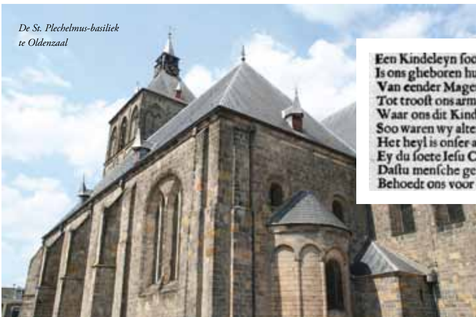
De St. Plechelmus-basiliek te Oldenzaal

Een Kindelyn soo lobentlijk Is ons gheboren huyden, Van eender Maget suyverlijk, Tot troost ons arme luyden: Waar ons dit Kindeken niet geboren Soo waren wy altemaal verloren, Het heyl is onser allen. Ey du loete Jefu Christ, Dafu mensche geboren bist, Behoedt ons voor de Helle.