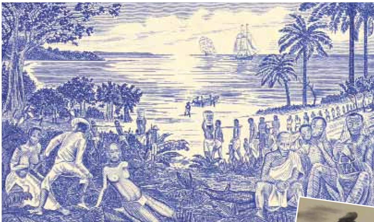
Slavenhandel; scène op het biljet van 500 pesos 1990 van Guinee-bissau