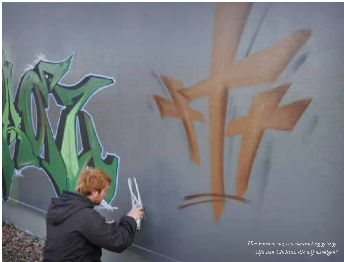
Hoe kunnen wij een waarachtig getuige zijn van Christus, die wij navolgen?

In een studentenstad was een studentengemeenschap op zoek naar een kerk voor hun zondagse bijeenkomsten. Een sterk vergrijsde gemeente in hun wijk wilde graag – om de kas te spekken – na de diensten de kerk beschikbaar stel-