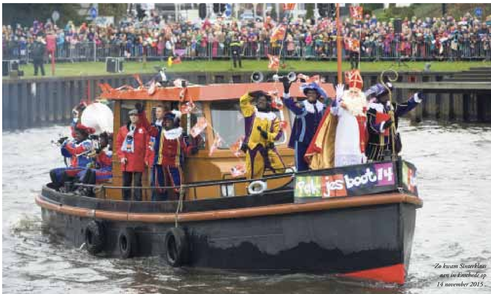
Zo kwam Sinterklaas aan in Enschede op 14 november 2015.