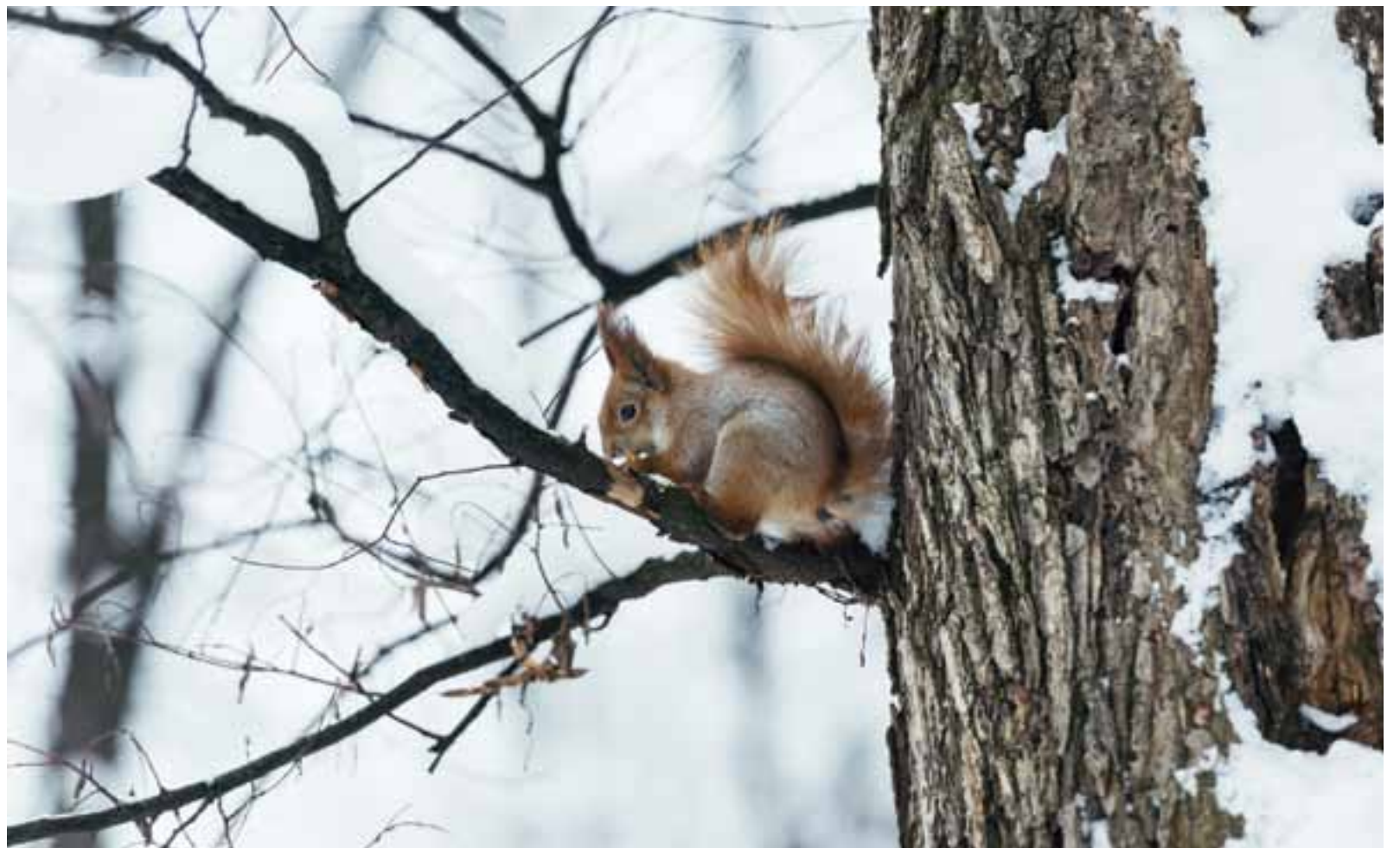
Een boom die in de winter dood lijkt, loopt in het voorjaar weer uit. 'Maar een mens sterft', klaagt Job. 'Hij blaast zijn laatste adem uit - waar is hij dan?'

Door Mij? Ja, Ik ben de opstanding en het leven, het eeuwige leven.