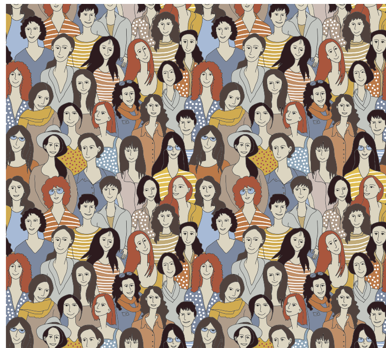
'De zachte krachten zullen winnen in het end', dichtte Henriette Roland Holst.

waar zijn de mannen toch gebleven? Aan het voetballen of biljarten? Moeten ze de kost verdienen voor vrouw en kinders? Ach, misschien zijn het wel de stille werkers op de achtergrond, wie zal het zeggen. Hun bescheidenheid siert hen.