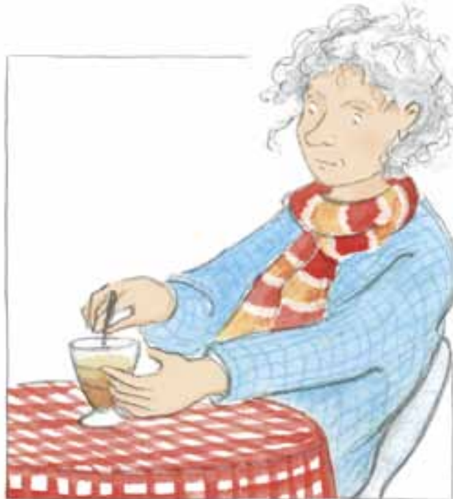
Illustratie: Hester Nijhoff

Geld, schoolcarrière, IQ... Het doet niet ter zake. Jan weet wat het belangrijkste is. God zorgt. Zo simpel is het.