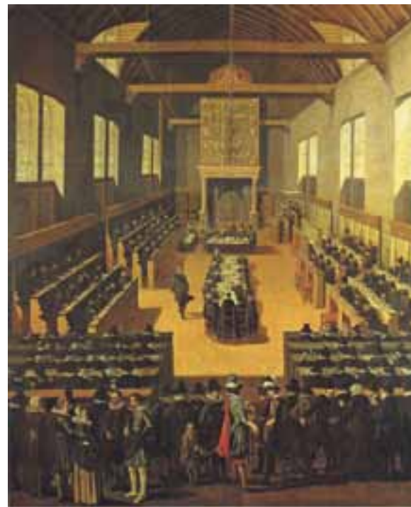
De Synode van Dordrecht, 1621, doek, Pouwels Weyts de Jonge

N.a.v: Liesbeth van Noordwijk (red.), Het Hof van Nederland. Dordrecht ; WBOOKS Zwolle, 2015; 144 p.; ISBN 978 94 625 8083 1; prijs: € 22,95.