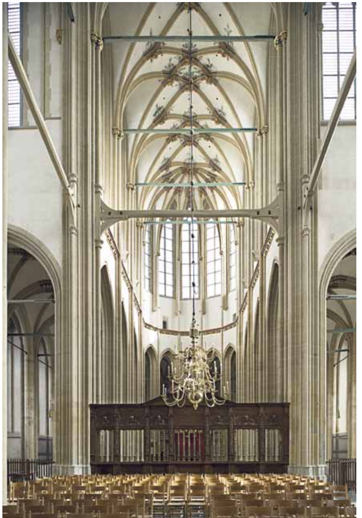
Zeventiende-eeuwse kroonluchter in de Bovenkerk te Kampen. Het koorhek is van vóór de Reformatie.

Een bijzonder onderdeel van het protestantse kerkinterieur is de doopboog boven de toegangsdeur(en) tot de dooptuin, de ruimte die door het doophek omsloten wordt. Gedurende de zeventiende en de achttiende eeuw en ook nog daarna zijn er vele vervaardigd. In de