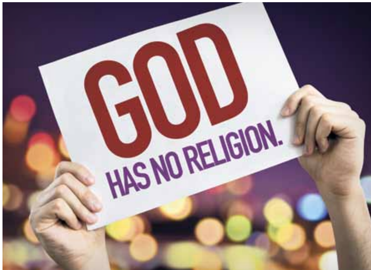
Een kerk die de kant kiest van machthebbers en geld, die geen plek inruimt voor lagere sociale klasse en geen rechtvaardige samenleving nastreeft, voedt het atheïsme.

Doordat wij God en menselijk lijden onmogelijk kunnen combineren, ontstaat atheïsme. Ook uit woede over en kritiek op het onrecht in de wereld. Het is een protest tegen de maatschappelijke en persoonlijke onrechtvaardigheden die vaak met godsdienst en God verbonden zijn. Mensen spannen God voor hun karretje.