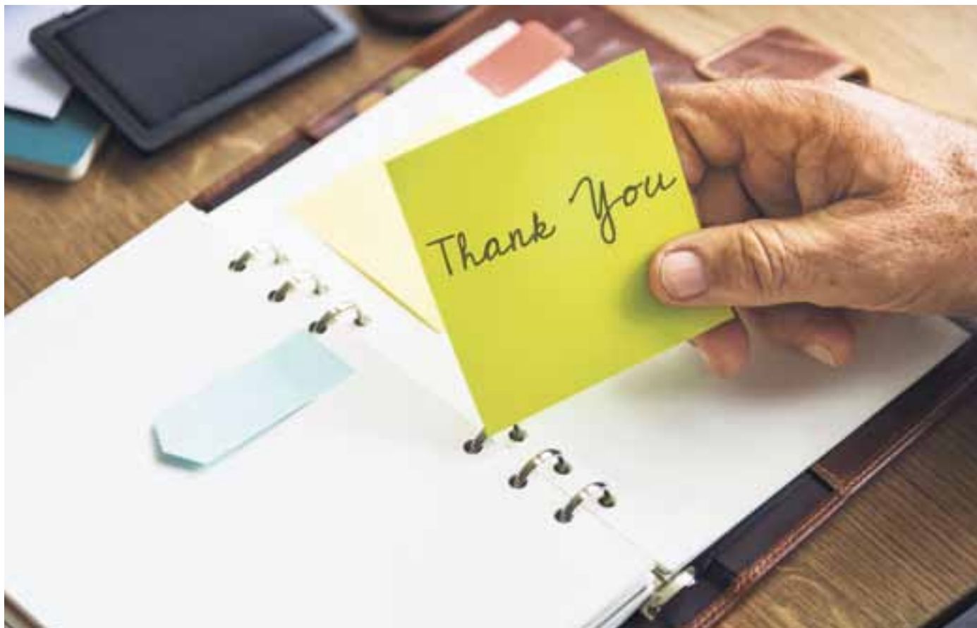
Onder alle omstandigheden kun je dankbaar zijn. "Dankt onder alles."

ook in een kerkenraad tijd te nemen elkaar te vertellen voor welke kleine en grote dingen in de gemeente je nu zo dankbaar bent. Je kunt bepaalde zaken op het spoor komen, waardoor je hart opbloeit, waardoor je kerk opbloeit. Je kunt kijken naar wat er allemaal niet is, maar het is zoveel vruchtbaarder om te zien waar Gods Geest aan het werk is in de gemeente. Immers daar bidden we toch om? Je gaat met andere ogen kijken als je dankbaar bent voor de Kerk die er is.