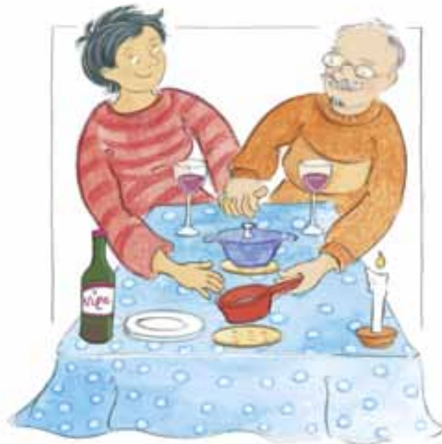
Illustratie: Heester Nijhoff

Er schiet me een gekkigheidje van thuis te binnen. Onze eet-tafel werd steevast gedekt met een ontbijtlaken, geen tafelzeiltje alsjeblieft. En ook geen pannen op tafel. Bij mijn moeder thuis - in Nederlands Indië - waren ze dat zo gewend. Als Indische ging ze nogal prat op haar ‘Europese’ opvoeding. Ze aten ‘Hollands’.