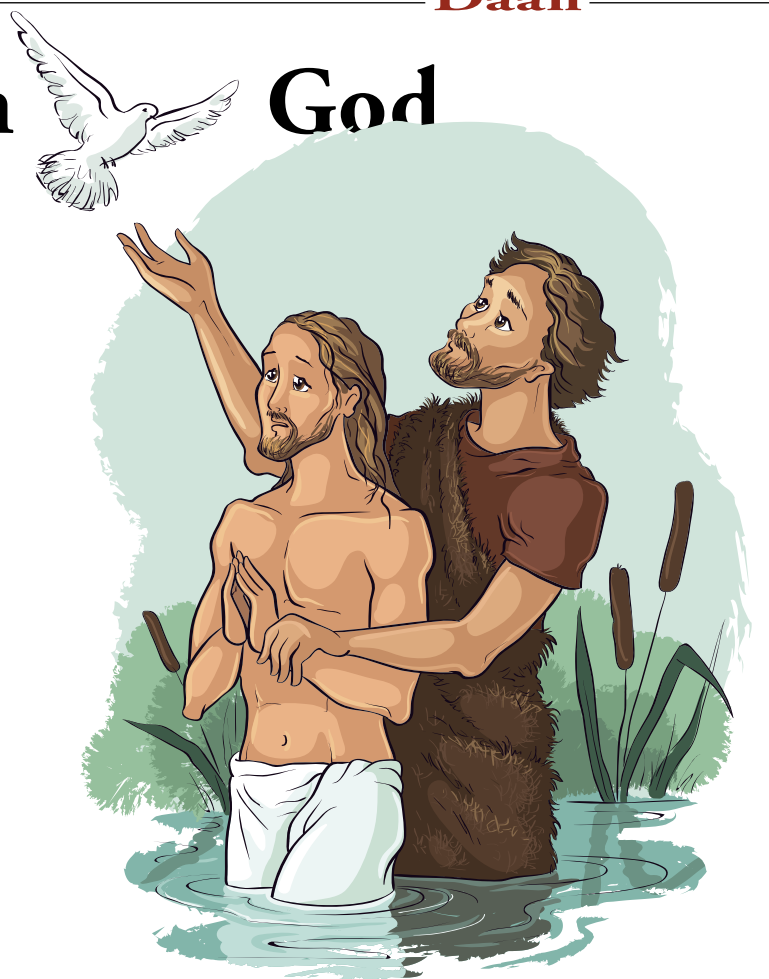
Henri Nouwen verwijst naar de doop van Jezus en de stem uit de hemel: "Deze is mijn geliefde zoon..."