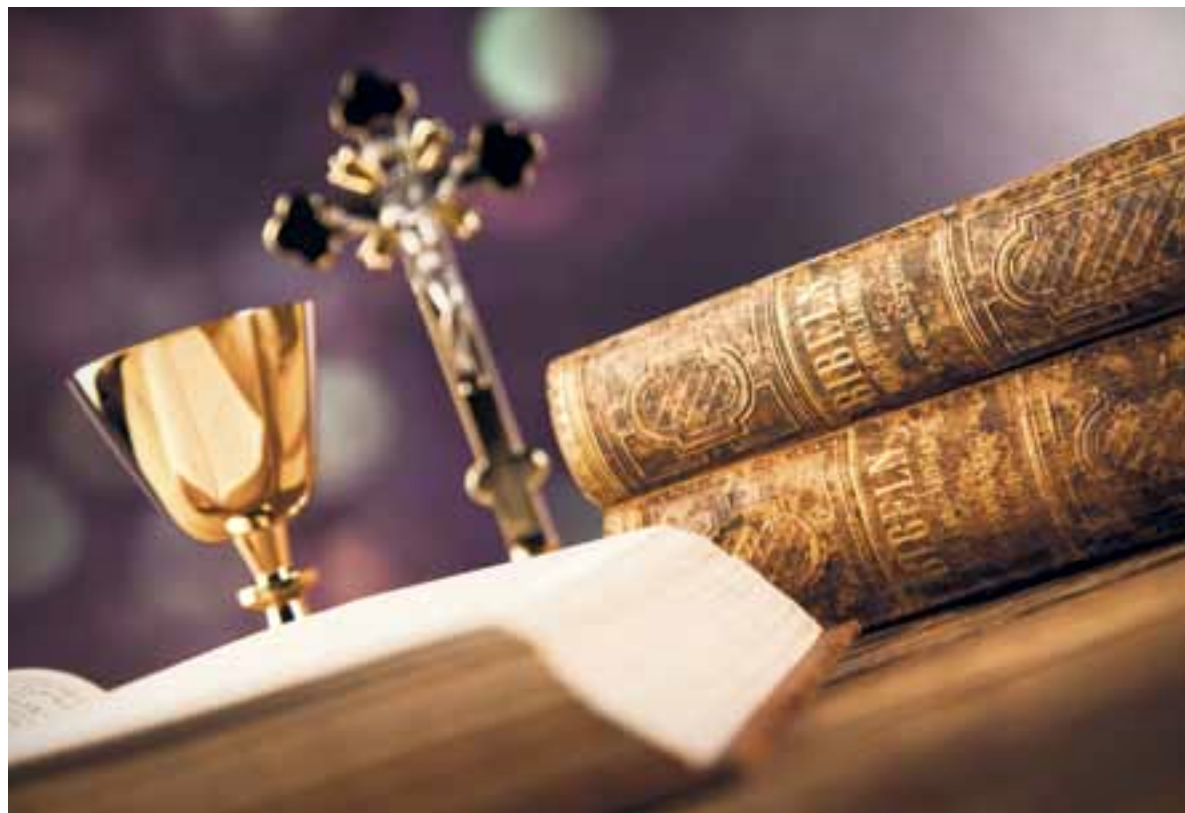
In de Rooms-Katholieke Kerk is meer aandacht gekomen voor het Woord, in de reformatorische kerken voor rituelen en symbolen.