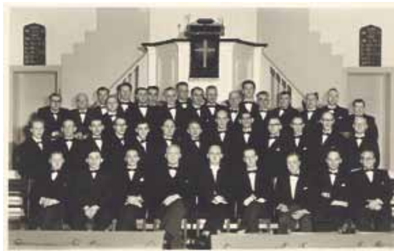
Het koor tijdens het eerste lustrum