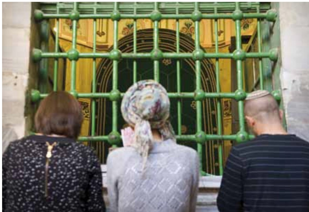
Het graf van Abraham te Hebron. De graven van de aartsuaders bevinden zich in de spelonk van Machpela.

DE JODEN ZIJN GEHECHT AAN HET LAND DER BELOFTE, DE ARABIËREN AAN HET STUK GROND WAAROP ZIJ HEBBEN GELEEFD. BEIDEN ZIJN GEHECHT AAN JERUZALEM