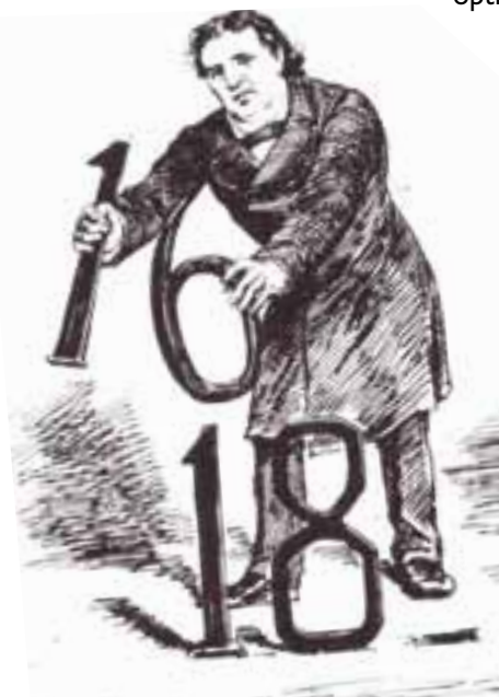
Van 1816 terug naar 1618. Spotprent op Abraham Kuyper en de Doleantie