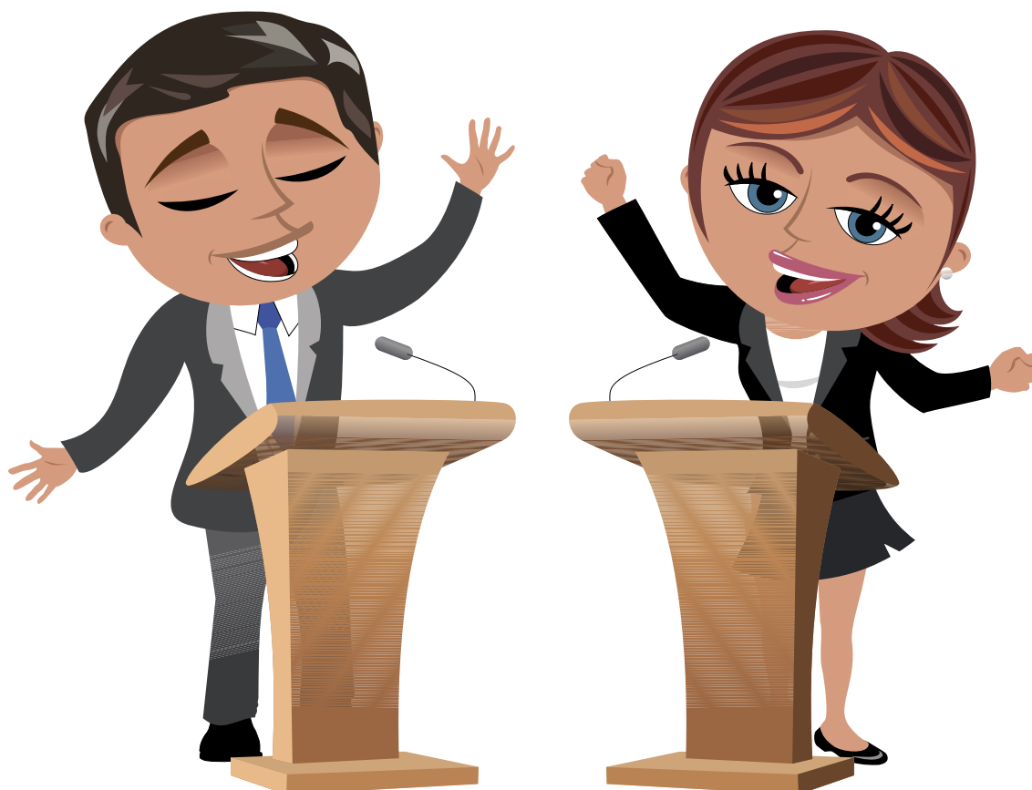
Voor een goede preek zijn persoonlijke kwaliteiten nodig: vroomheid, roeping, gedrevenheid. Hartstocht om de hoorders op een dieper niveau te raken...

Dit was het tweede deel van een tweeluik over preken.