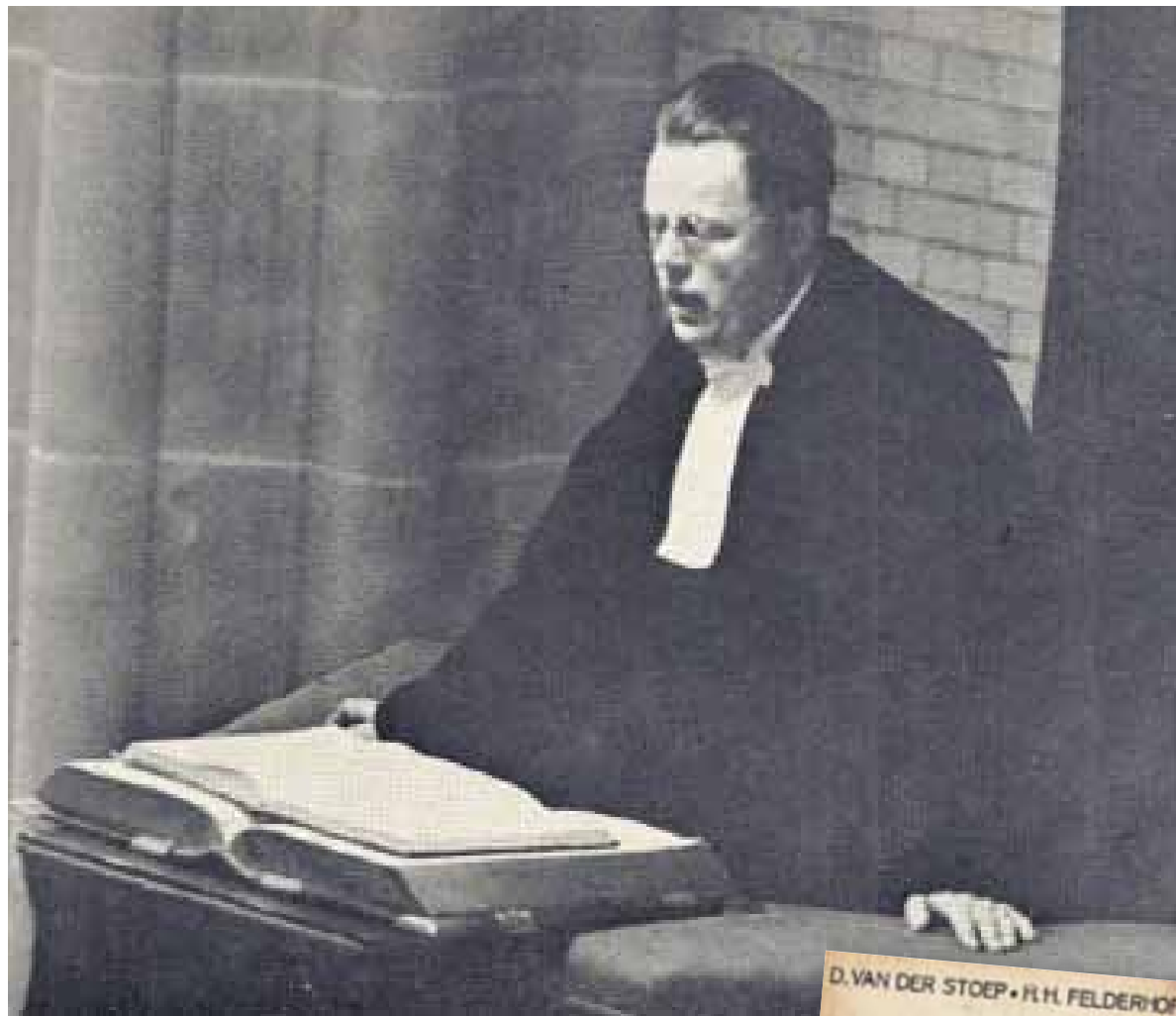
Op de foto: De befaamde theoloog Miskotte op de kansel in 1940.