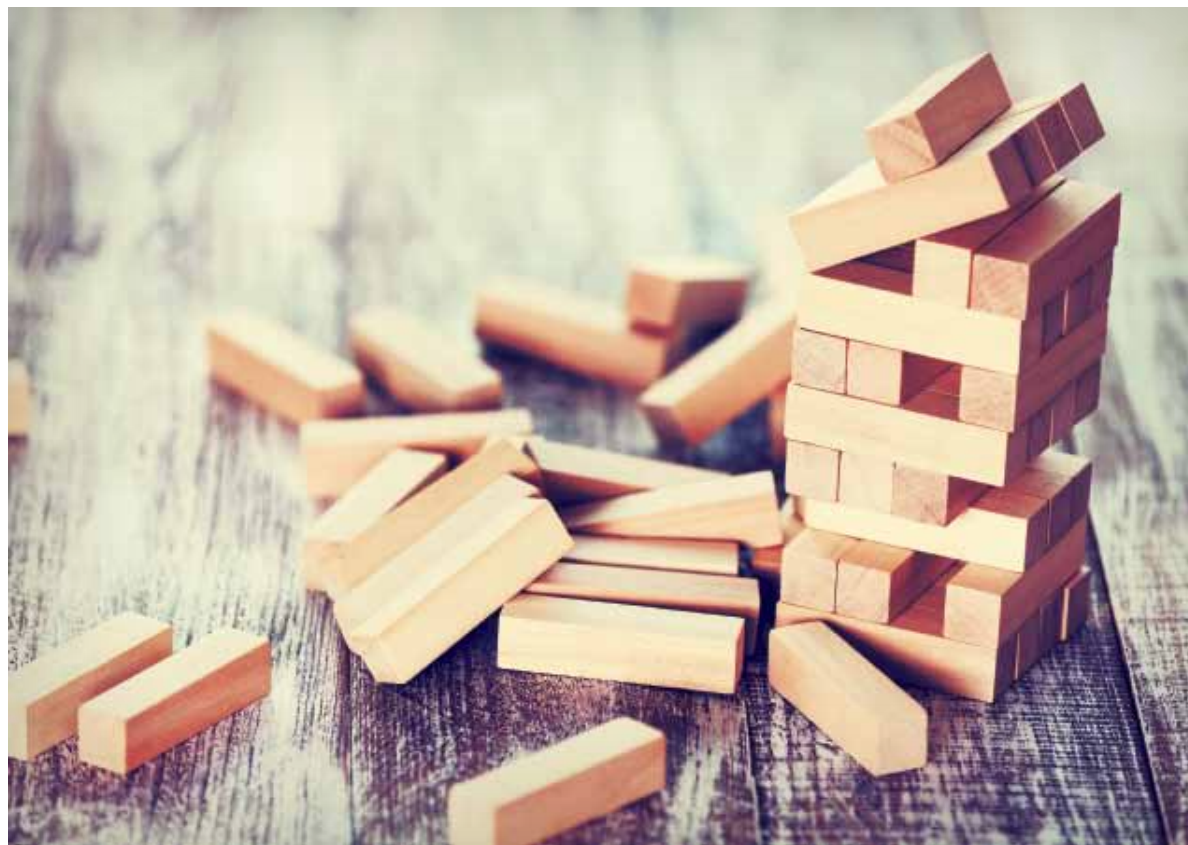
In het Koninkrijk van God word je niet gevraagd toeschouwer te zijn, maar een bouwer, die zijn of haar steentje bijdraagt

De meeste jongeren kozen voor: durf te organiseren. Ze konden