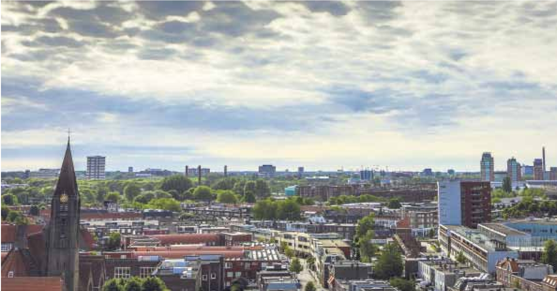
In Utrecht studeren heel wat jongeren uit het hele land. De bloeiende kerkgemeenschap van de Nieuwe Kerk heet hen van harte welkom.

Student in Utrecht? Kom naar de Nieuwe Kerk!