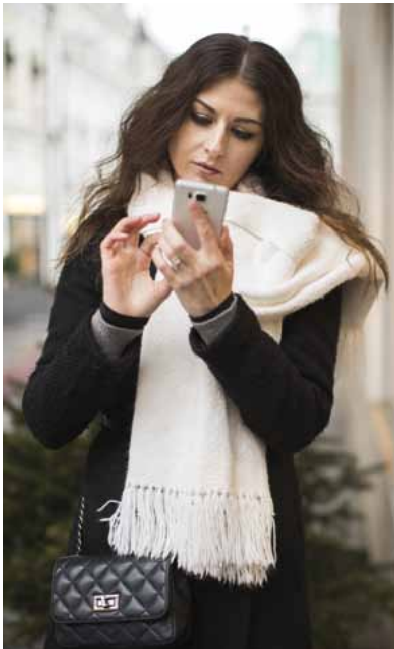
Gewoon te veel drukte en andere dingen na werktijd.