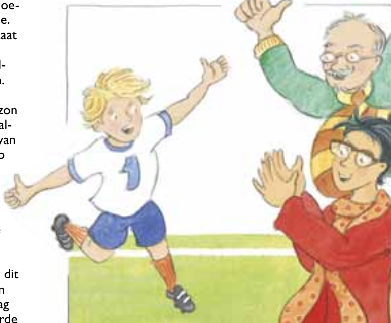
Illustratie: Hester Nijhoff

Zijn neef Gabriël, die bij ons aan tafel zit, luistert aandachtig. "Ik kan ook goed voetballen", zegt hij en verhaalt over zijn eigen heldendaden op het veld, zoals die prachtige sliding laatst.