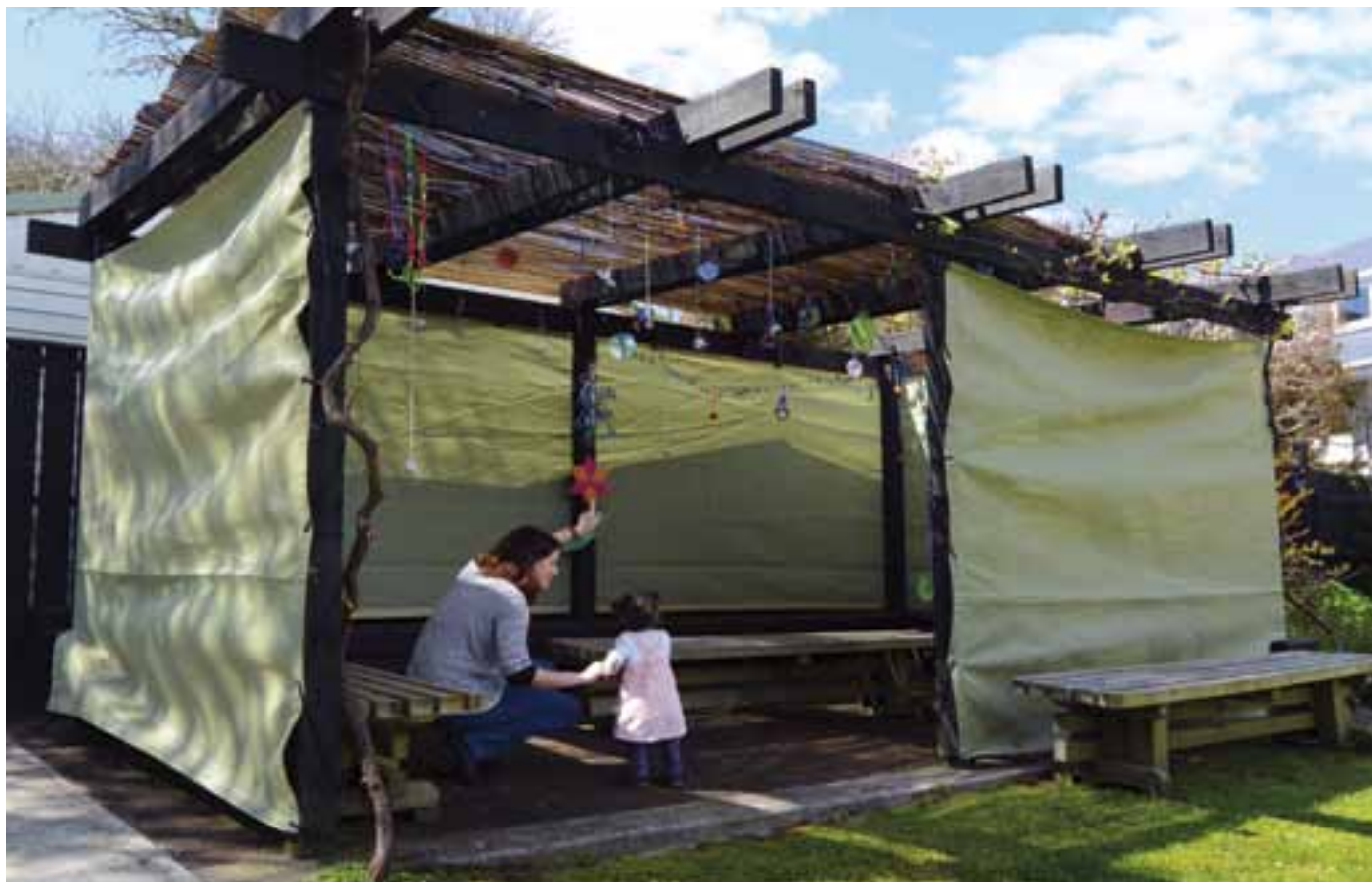
Op het Loofhuttenfeest doe je afstand van uiterlijkheden, comfort, afleiding, zorgen; je leeft als gezin een week in een eenvoudige hut. Dit feest geeft een handreiking om in een staat van blijdschap te kunnen leven...