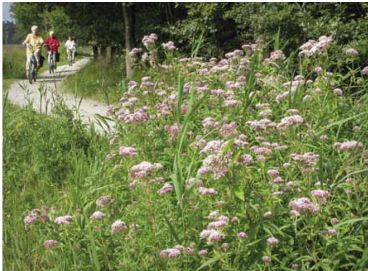
Gezamenlijk ontbijten, een fietstochtje met z'n allen, op startzondag wordt van alles uit de kast gehaald, om daarna in het nieuwe kerkelijk seizoen weer volop aan de slag te gaan.

Toch kun je gebukt gaan onder de zorgen om de kerk. Hoe komt het dat er mensen zijn