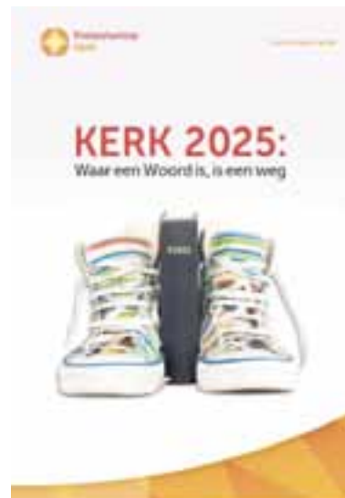
Met het proces Kerk 2025 wil de Protestantse Kerk terug naar de kern. Het geloof en de geloofsgemeenschap zijn de basis. Om van daaruit volop kerk in de samenleving te zijn.

DE CLASSISPREDIKANT HEEFT EEN BIJZONDERE BEVOEGDHEID, MAAR VAN PERSOONLIJKE 'DOORZETTINGSMACHT', ZOALS DAT OOK WEL IN DE KERK HEET, IS GEEN SPRAKE.