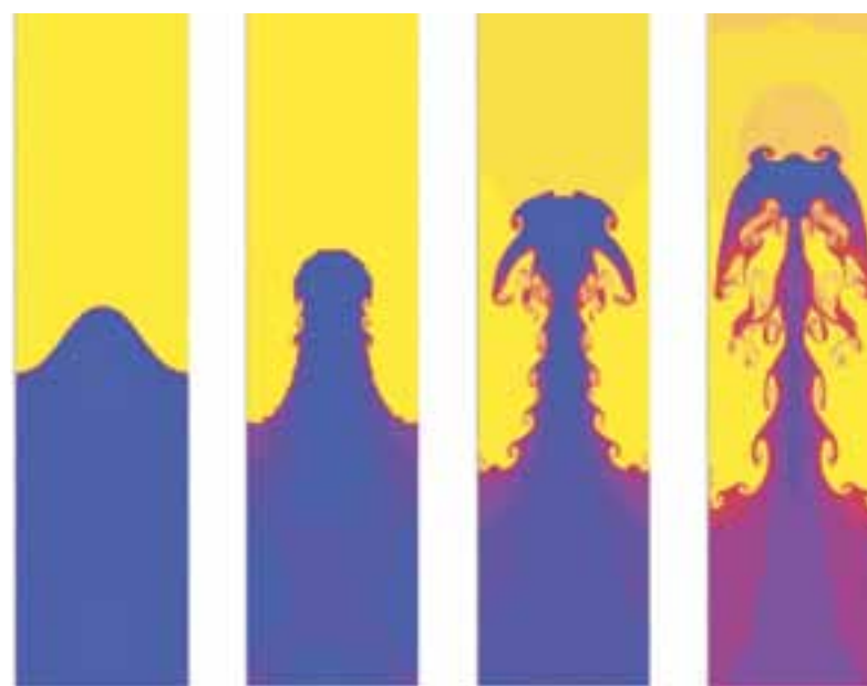
Het dynamische gedrag van twee niet-mengende vloeistoffen met een verschillende dichtheid. NB: de bereikte vorm is vrijwel gelijk aan de zoutpijler bij de Noordkaap.