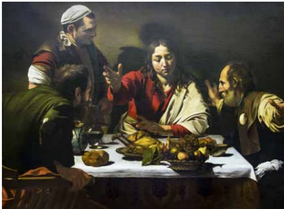
Jezus heeft een goed gesprek met de Emmaüsgangers (door Michelangelo Merisi da Caravaggio (1571-1610), National Gallery, Londen)

IN EEN GOED GESPREK WORDEN NIET ALLEEN FEITEN EN STELLINGEN UITGEWISSELD, MAAR WORD JE GEHOLPEN OM JE EIGEN VERHAAL TE VERTELLEN.