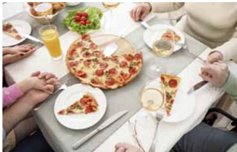
Bidden voor het eten. Vormen komen op en verdwijnen, de Geest maakt en houdt levend.

Vormen komen op en verdwijnen, de Geest maakt en houdt levend.