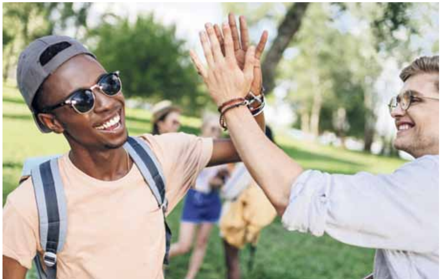
'Er is geen grotere liefde dan je leven te geven voor je vrienden.'

De inzet, de opoffering van mensen is gebaseerd op, geïnspireerd door de vriendschap van Jezus, door de liefde van God, geopenbaard in degene die over Zichzelf gezegd heeft: '(...) de Mensenzoon is niet gekomen om gediend te worden, maar om te dienen en zijn leven te geven als losgeld voor velen.' Jezus Christus: de World Servant bij uitstek.