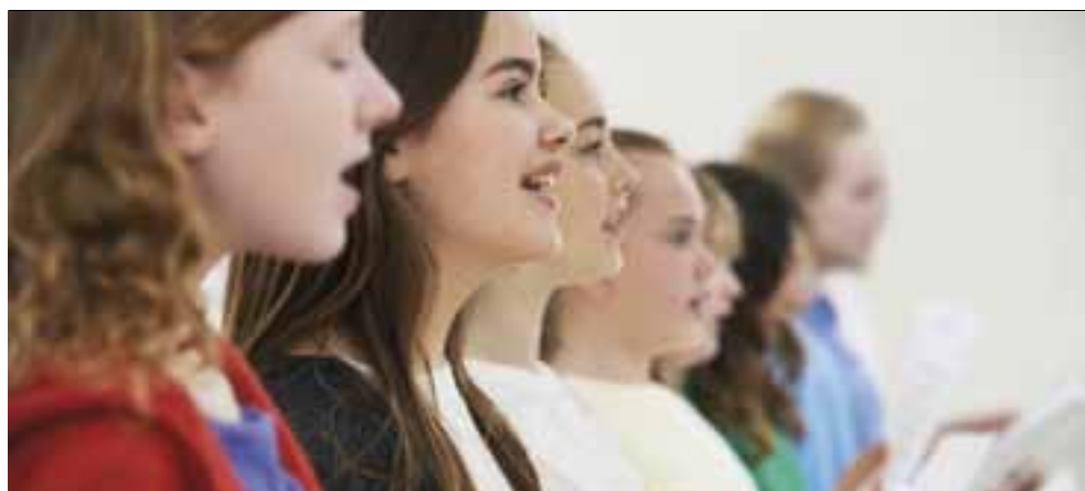
Iedereen, jong en oud, is van harte welkom.

Mail naar nieuws@gezamenlijkzondagsblad.nl Gratis plaatsing!