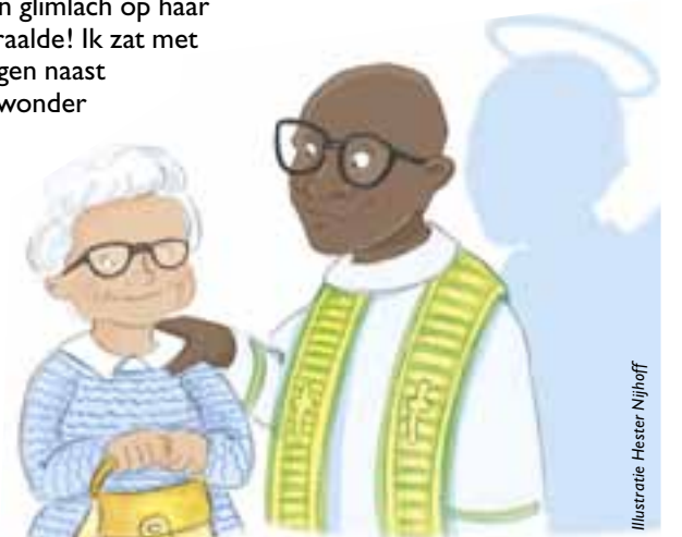
Illustratie Hester Nijhoff

De auteur is zangeres, schrijver en levenskunstenaar.