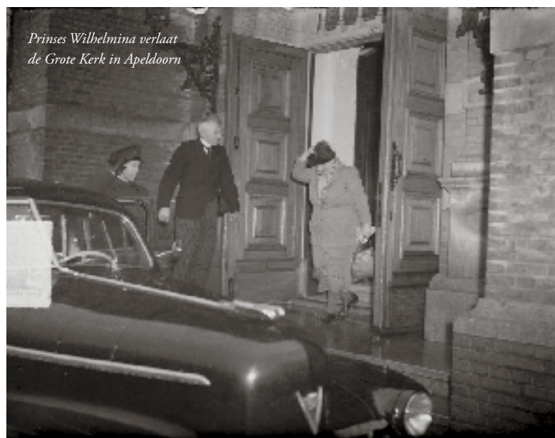
Prinses Wilhelmina verlaat de Grote Kerk in Apeldoorn

Het adres van de Grote Kerk: Loolaan 16, 7315 AB Apeldoorn. Eén van de vele concerten bezoeken? Kijk op: www.grotekerkapeldoorn.nl/concertagenda