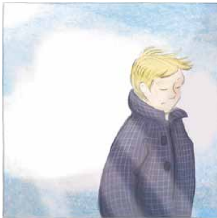
Illustratie: Hester Nijhoff

geleden, toen hij nog een tiener was. In die tijd was het nog gebruikelijk dat er voortgangsgesprekken over hem gevoerd werden waarbij hij zelf niet aanwezig mocht zijn.