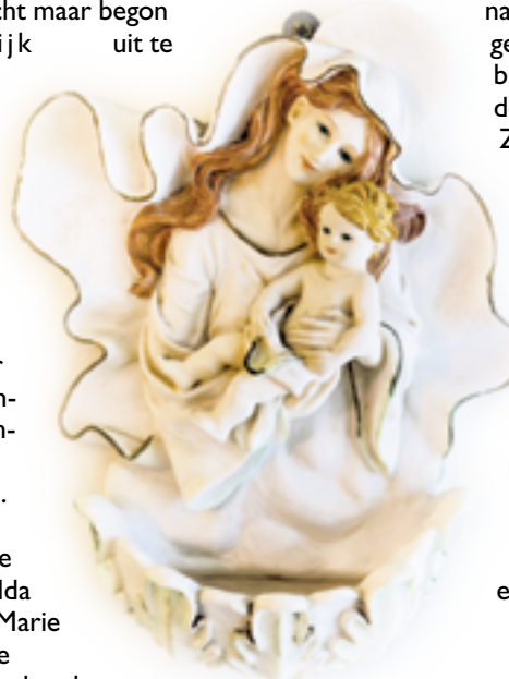
Wijwatervat bij ingang van de katholieke kerk

Over die maaltijden valt heel wat meer te vertellen. Maar ook over gesprekken met de paters en met andere gasten. En over de conventsmis, de dagelijkse eucharistieviering. Dus over twee weken ga ik nog even door.