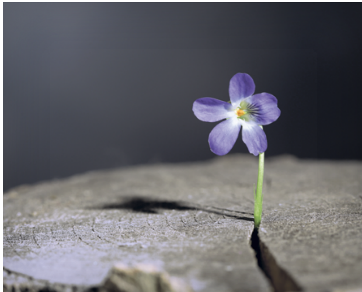
Geworteld in Gods liefde, gevormd door Zijn handen, geplaatst op deze wereld...zoals Hij ons heeft bedacht.

DIE HOUDING: WETEN WIE JE BENT, WETEN WIE JE HEEFT BEDACHT, EN OM DIE REDEN ZO PRACHTIG EN KRACHTIG WORDEN ALS JE MAAR ZIJN KUNT.