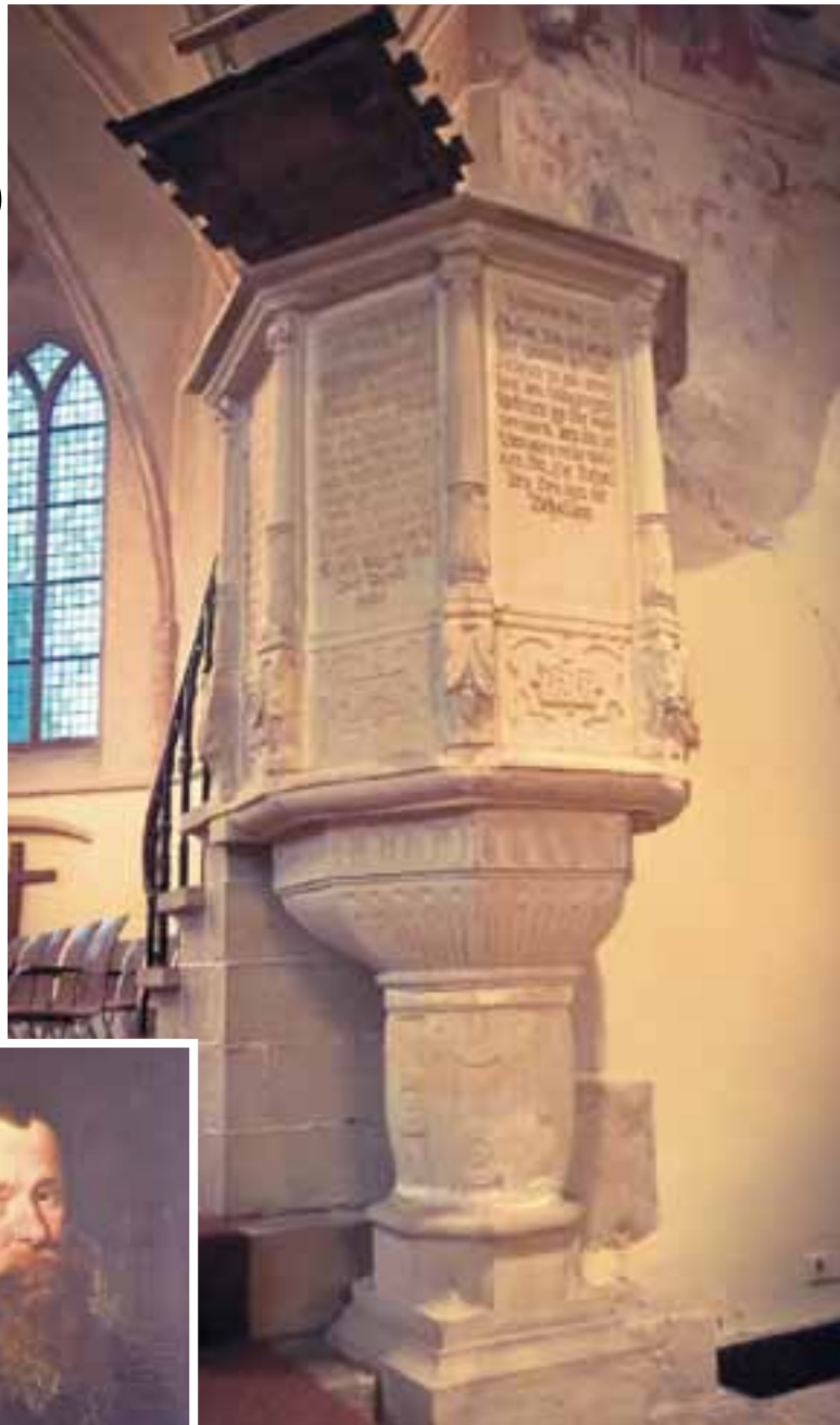
Dat de gemeente van Borne aan het begin van de zeventiende eeuw luthers was, is nog te zien aan de preekstoel, die omstreeks 1600 vervaardigd is. Op de panelen en het deurtje zijn teksten van Luther aangebracht in een Oost-Nederlands en een Münsters dialect.

In 1618 blijkt er sprake te zijn van ongepast gedrag op zon- en feestdagen, tijdens de kerkgang en op de kerkhoven 'Dat het arbeyden op sondagen, fest- ende beededagen, item die vastelavonts- ende papegayebieren, alsoick het schieten, trommelen ende derglijcken