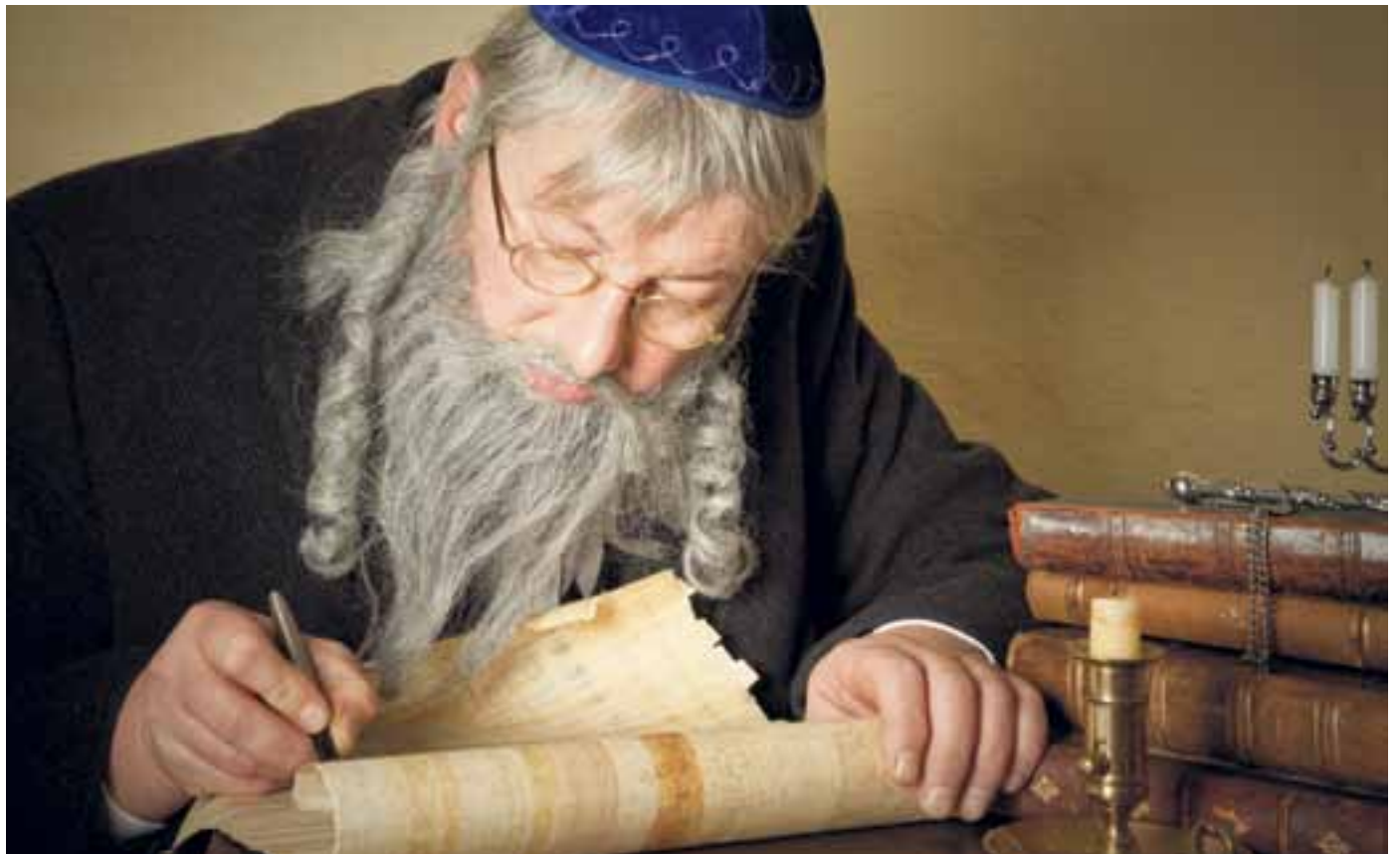
Een Schriftgeleerde, met een echte 'schriftgeleerdenvraag', destijds onderwerp van theologisch debat: Welk gebod is het grootste?

Jezus voegt de daad bij het woord en vervult de wet aan het kruis. Geen grotere liefde dan die zijn leven geeft... Ons rest ons hele leven te blijven bezien vanuit dat perspectief, en Zijn liefde daar maximaal in laten doorwerken.